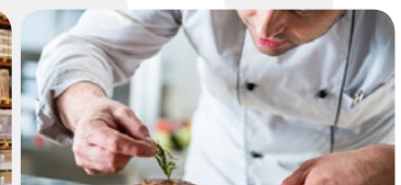
HOTEL & GASTRONOMIE