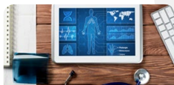
SERVICES DE SANTÉ