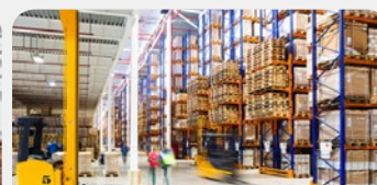
COMMERCE ET SERVICES