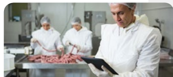
USINES DE VIANDE