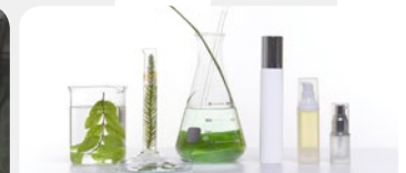
PRODUITS DE BEAUTÉ